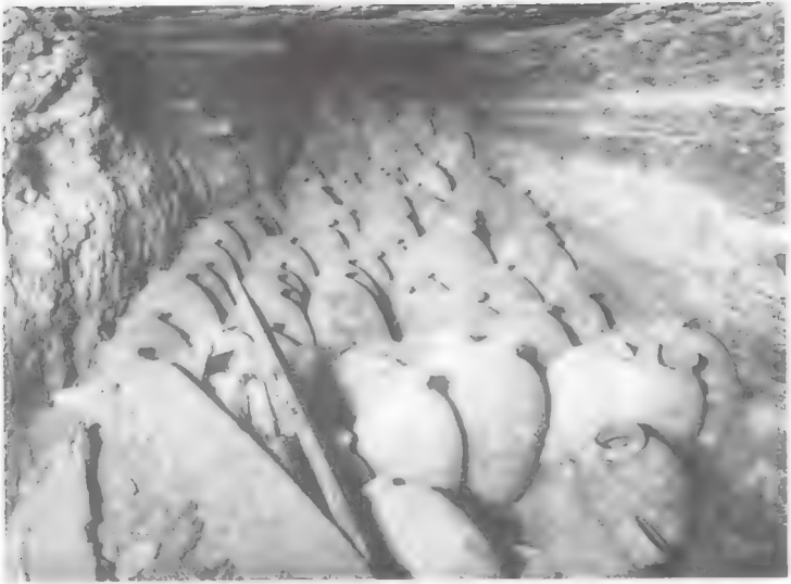
١٩٣٢ : أواني الفخار التي عثر عليها في أسفل الهرم المدرج